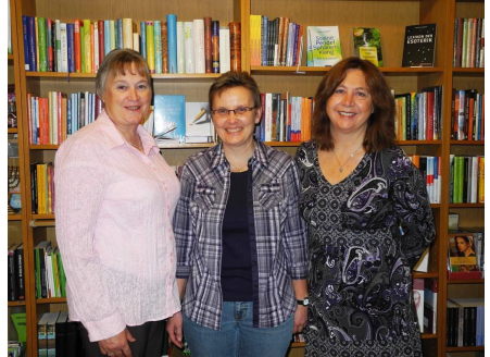
Wir freuen uns auf Ihren Besuch und beraten und bedienen Sie gerne.

Buchtipps – Buchtipps – Buchtipps – Buchtipps – Buchtipps – Buchtipps – Buchtipps