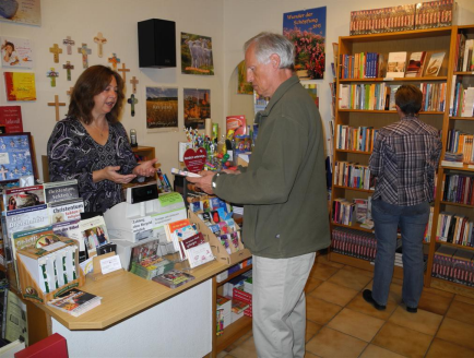
Bücherstube an der Stadtmauer 10, kostenlose Parkplätze für die Zeit Ihres Einkaufs.

An der Stadtmauer 10, 87435 Kempten, Tel./Fax: 0831-27913, Email: cbske@gmx.de Öffnungszeiten: Mo – Fr 9 00 –12 30 und 14 00 –18 00 , Sa 9 30 –13 00