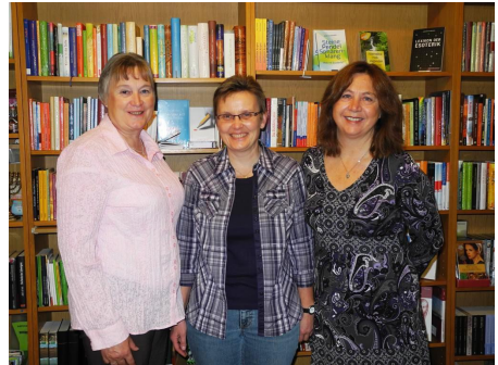
Wir freuen uns auf Ihren Besuch, wir beraten und bedienen Sie gerne.

Buchtip – Buchtip – Buchtip – Buchtip – Buchtip – Buchtip – Buchtip