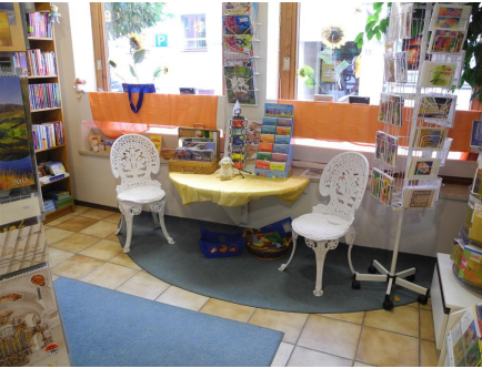
Bücherstube an der Stadtmauer 10, kostenlose Parkplätze für die Zeit Ihres Einkaufs.

An der Stadtmauer 10, 87435 Kempten, Tel./Fax: 0831-27913, Email:cbske@gmx.de Öffnungszeiten: Mo – Fr 9 00 –12 30 und 14 00 –18 00 , Sa 9 30 –13 00